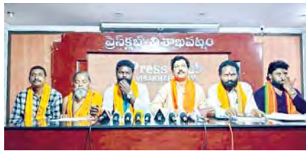
విశాఖపట్నం, మే 18, ప్రభాతవార్త